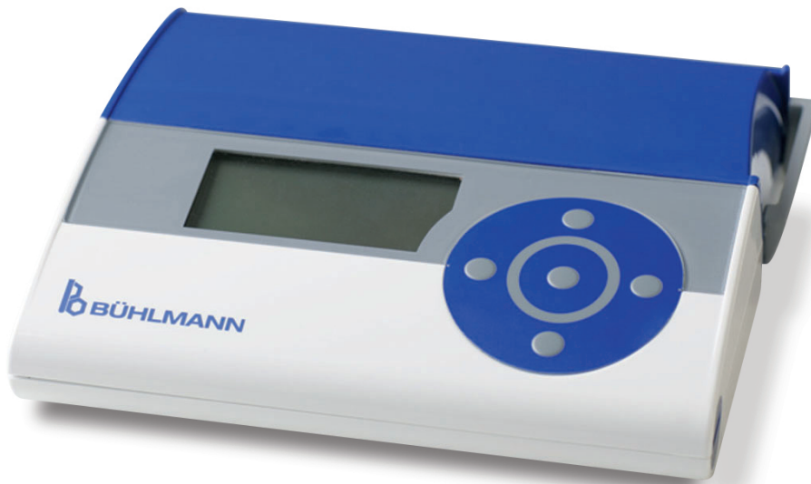
Quantum Blue® Reader

рефлектометр для количественного экспресс-определения кальпротектина в образцах кала